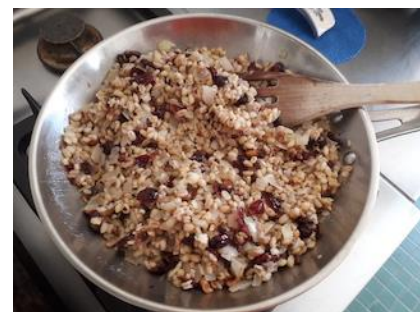
Riz, canneberges, oignons, noisettes