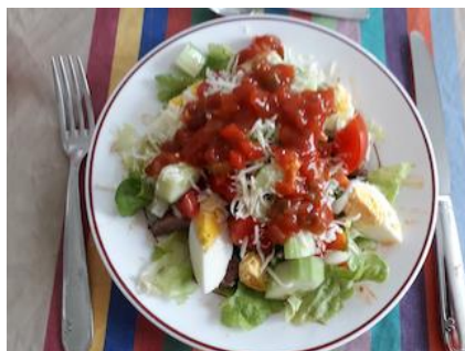
Salade de taco