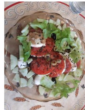
Salade de tomate et mozzarella