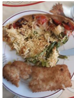
Poisson et pizza "à la française"